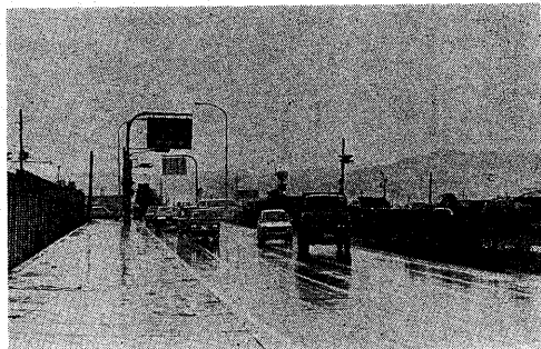
道中の広い大久保バイパス—国道大久保交差点の交通緩和に役立っています (安田地区で)

工事昭和四十四年から、約三十億円の工費で完成した。このバイパスの開通で、国道二十四号線の交通の緩和が期待されています。 大久保バイパスの開通により、国道二十四号線の交通が緩和され、大久保地区の交通がスムーズになります。