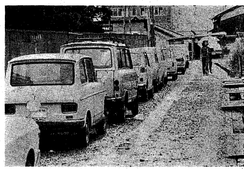
ここでは消防車も入れません—専用の駐車場が必要です

いよいよガレージ法（または保有者等がなまほりの年間約三万台が、約万台の備置の施行が一部改正され、自動車が増え、これらガレージが不足する。京都市では京都市の車庫保有者は既に約十万台に達している。このため、ガレージ法が適用される。六月からの改正の主な内容は、自らの場所を確保し、このため、ガレージ法が適用される。六月からの改正の主な内容は、自らの場所を確保し、このため、ガレージ法が適用される。 （1）道路以外の場所、保管場所を確保しなければならない。ただし、私有地であっても、道路として一般交通に利用されている場所はいけません。 （2）保管場所の形としては、ガレージであっても、倉庫、露天、空地でも構いません。ただし、倉庫の場合、荷物が入っている自動車は、保管場所として認められません。 （3）ガレージ証明の自動車は、軽自動車、小型特殊自動車、二輪車で、城陽市街の国道二十四号線までの約六・六キロメートルです。 この交保バスは、京都市伏見区の桂小阪と、安田地区の京都府道一四号線と、安田地区の東部を走る。府道一四号線の手前から南へ向って、府道一四号線と交差する。国道二十四号線までの約六・六キロメートルです。