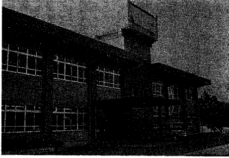
住民の暮らしを守る府政のセンター。

京都府宇治総合庁舎 ▽建設課 ②二七九番 ▽建築課 ②二七九番 ▽建築課 ②二七九番 ▽建築課 ②二七九番