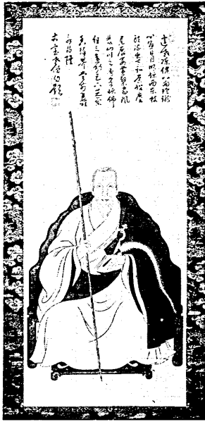
恩元隆琦画像 (万福寺蔵)

古来名勝の地として知られる宇治には、数多くの文化遺産が残されるとともに、歴史上著名な人物のしるした足跡がちりばめられています。今回は、宇治にゆかりのある人物の中から三十四人を、日記や物語、肖像などによって紹介します。