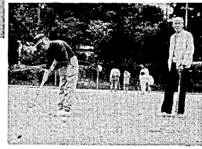
市民スポーツまつり