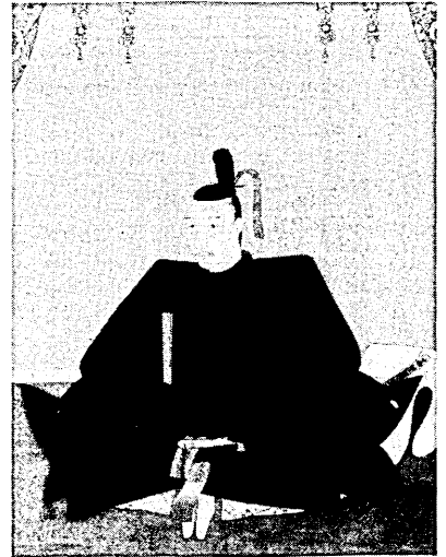
織田信長画像 (京都・大雲院蔵)