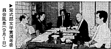
紫式部文学賞選考委員会議風景(9月1日)