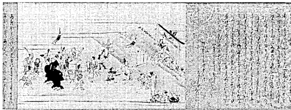
宇治拾遺物語絵巻<重要美術品>(京都・陽明文庫蔵)

■開館時間 午前9時~午後5時 ■休館日 月曜日・祝日 ■入場料 大人 200円 小・中学生 60円 ■展示図録 800円 折居台1丁目・文化センター内 ☎20・1311