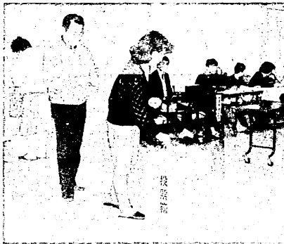
私たちのまちの市長は、私たちみんなの投票で選ぶ(写真は前回の市長選挙)

十二月六日(日)は、宇治市長選挙の投票日。市長選挙は、今後四年間市政を担当する市長を決める、とても身近で大切な選挙です。投票日には、棄権することなく、必ず投票しましょう。