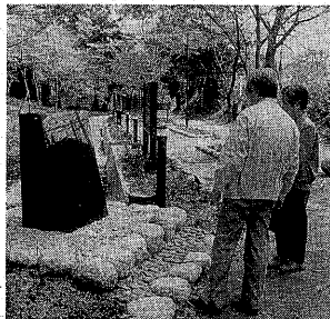
税金は、暮らしの周辺整備や住みよいまちづくりなどのために生かされています(写真は昨年建てられた、大吉山登り口前の万葉歌碑)

住民税・市役所市民税課 (☎22・3141、内線2121~2123) 所得税・消費税・宇治税務署 (☎44・4141) 申告のことなら気軽にお問い合わせください