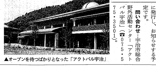
▲オープンを待つばかりとなった「アクトパル宇治」

宇治市西笠取の地に待望の総合野外活動センター「アクトパル宇治」(宇治市西笠取江出川西一番地)が完成し、六月四日(金)のオープンを待つばかりとなりました。 施設を紹介や利用の案内については、詳しくは市政だよりから個人まで多目的に利用できる施設です。 施設紹介や利用の案内については、詳しくは市政だよりから個人まで多目的に利用できる施設です。