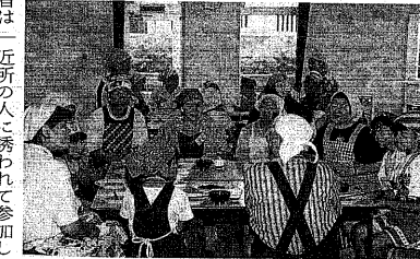
◆「ハイッ」出来上がり。クッキングでの楽しい語らい