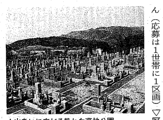
▲山あいに広がる静かな墓地公園