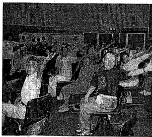
「結び」の展示作品に見入る参加者

◆油絵サークル(四季彩、水曜会、サークルFR、創画会、エム・ピー)合同展 7月11日(日)、午前10時～午後4時、中央公民館。無料。伊佐さん(☎32・4044)。