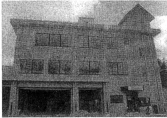
▲新しい東消防署、3月16日撮影

東消防署の新しい庁舎が完成しました。四月三日に移転し、東宇治地域の火災や救急などに備えます。 新しい東消防署は、古い庁舎のおよそ四〇〇メートルほど北にあり、鉄筋コンクリート造り一部二階建て。昨年より工事を進めてきた東消防署の新しい庁舎がこの程完成し、四月三日から業務を開始します。