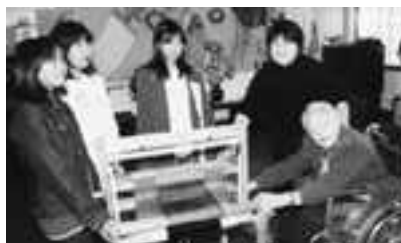
「さをり織り機」をプレゼントする児童たち

「さをり織り機」は児童会が空き缶回収で得たお金を代金の一部として購入しました。小倉デイサービスセンターが学校の敷地内にあるため、児童たちは昼休み時間に、風船パレーなどの簡単な遊びをお年寄りと一緒にして交流を深めています。「今年は、遊び友達になろう」をキャッチフレーズと一緒に遊べる器具を探していました。さをり織り機はたて糸が最初にセットしてあるので初心者でも操作が