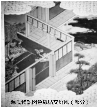
源氏物語図巻紙貼交屏風(部分)

期間 10月7日(土)~28日(土) 開館時間 午前9時~午後5時(入館は4時半まで) 休館日 月曜日(祝日の場合は翌日) 観覧料 大人500円、小・中学生250円 (常設展と共通)