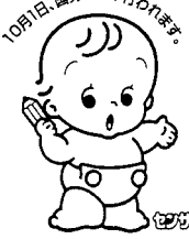
10月1日、国勢調査が行われます。