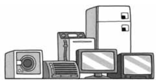
㊦ごみ減量推進課・事業課

家電リサイクル法の対象品目に液晶・プラズマテレビ、衣類乾燥機が追加されました。処分方法は従来の対象品目(ブラウン管テレビ・エアコン・冷蔵庫・冷凍庫・洗濯機)と同様です。詳しくはごみ減量推進課・事業課へお問い合わせください。