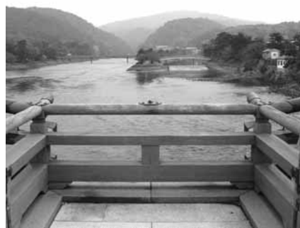
▲宇治橋三の間から見る宇治川

文化的景観とは、人々の生活や生業の中で、その地域独特の自然風土と共に長年かけて作られてきた景観のことを言います。現在の宇治の景観は、宇治川に育