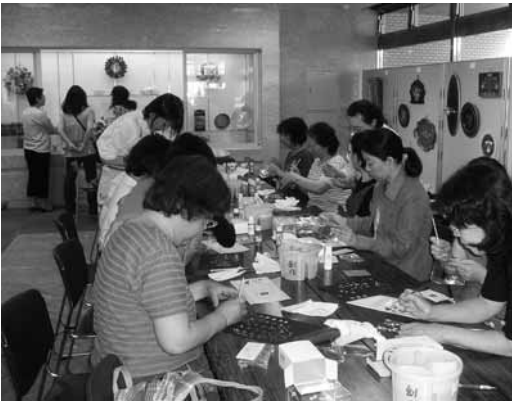
▲ロビー展示作品のミニ講習会の様子

書に書き、2月1日(月)までに郵送か直接、資産税課へ提出してください。申告書の書き方が分からない場合は、印鑑と税務申告資料など、個々の減価償却資産の明細が分かる書類を持って、資産税課へお越しください。※20年度の税制改正で、機械・装置を中心に耐用年数が大幅に変更されましたのでご注意ください。