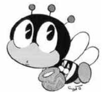
生涯学習のマスコット「マナビ」

◆申し込み…参加日・住所・氏名・電話番号を、2月5日(金)までに電話・Eメール・直接で、同センター(☎39-9500、shogai@agakushu@city.uji.kyoto.jp)へ。