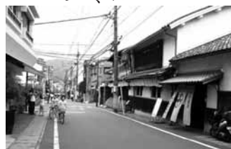
▲現在の景観は過去の積み重ねです

今の宇治橋通りには茶問屋が点在しますが、江戸時代には「宇治茶師」の邸宅が建ち並びました。「宇治茶師」は屋敷の奥に茶工場、その後に覆下茶園を設けた独特の邸宅に住んでいました。近代に入ると茶生産者の再編が進み、一部は町屋化され、成功した茶問屋は大邸宅を構えました。現在も、宇治橋通りには昭和初期に百貨店として開業した建物が残されており、衣料品・食料品等を売る店舗が建ち並ぶようになった近代の面影を残しています。 このように、現在の宇治の景観は風土と人々の営みの積み重ねによって作り上げられた独特のもので、現在でも宇治茶の名は全国に名を馳せ、宇治の街に軒を連ねる茶問屋は賑わっています。 では、国宝・重要文化財と並ぶ文化的景観として認められた「宇治の文化的景観」を、私たちはどのようにして守り伝えていけばいいのでしょうか。最終回である今回は、それについて考えてみたいと思います。