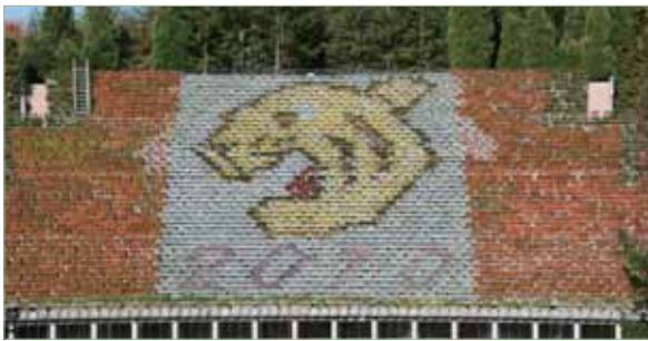
同園の「花と水のタペストリー」は草花の色を利用して絵柄をデザインした日本最大級の立体花壇です。2月下旬まで、今年の干支「寅」をお楽しみいただけます。皆さんぜひお越しください。