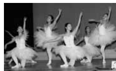
▲市民文化芸術祭の様子