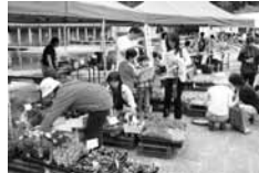
▲花・苗・鉢などの販売の様子