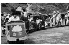
▲ミニ鉄道運行の様子