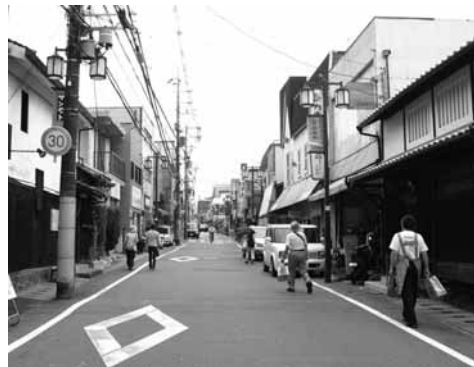
▲現在の宇治橋通り

宇治橋通り。この通りもまた、重要構成要素の一つです。貴族の別業地だった宇治は、近世に入ると茶業のまちへと転換します。当時は、「宇治茶師」と呼ばれる茶の製造家が宇治橋通りに邸宅の軒を連ねていました。邸宅は表が町屋で中に茶工場を設け、奥に茶畑を持つのが特徴です。