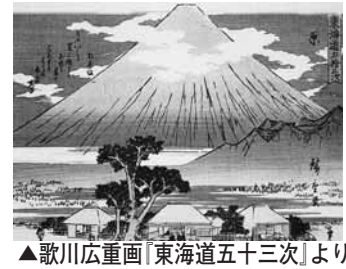
▲歌川広重画「東海道五十三次」より