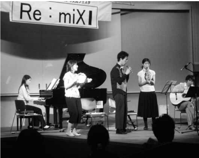
▲あなたの出演・出展をお待ちしています(写真は昨年度の様子)

「ステージ部門」と「展示部門」の2部門を募集します。いずれもジャンルや内容は問いませんが、営利・宗教・政治活動を目的とする応募はできません。