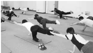
▲あなたも腰痛予防を始めませんか(写真は昨年の様子)

年齢を重ねていくと、体のあちこちの関節が痛みやすくなります。この講座では腰痛を予防するための日常生活の方法を学びます。