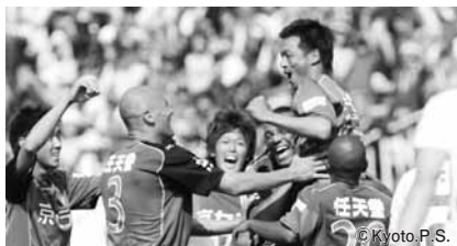
園市生涯学習課 京都サンガ F.C. (☎ 55-7603)