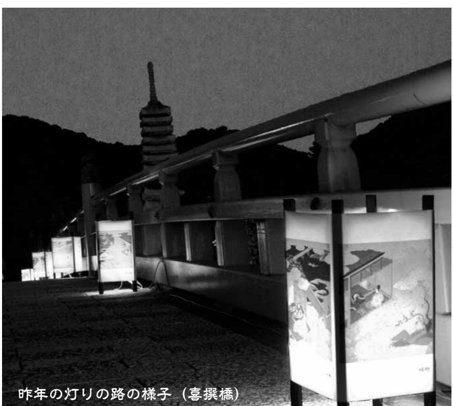
昨年の灯りの路の様子(喜撰橋)