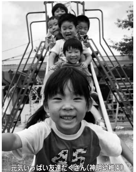
元気いっぱい友達たくさん(神明幼稚園)

全国幼稚園ウィークin うじ 「幼稚園から小学校へ…学びの連続性」をテーマに園児たちが共同制作した作品及び公立幼稚園の保育活動と教育内容を紹介します。 ◆とき…9月15日(火)～18日(金)は午後3時(時まで) ◆ところ…市役所1階市民ギャラリー1 園木幡幼稚園(☎ 39・9292) ◆入園の決定…応募者が定員を上回った場合、10月中旬に抽選を行います。