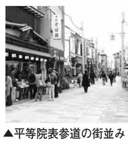
▲平等院表参道の街並み

①歴史・文化や景観を守り育てるまちづくり 市民が宇治の歴史や文化・景観に誇りと関心を持ち、これらをまちづくりに生かすとともに、宇治茶を文化としてさらに発展・継承していくまちづくりを推進します。 ②来訪者が何度も来たる、潤いと賑わいあふれるまちづくり 宇治を訪れる人が、何度でも来たるような魅力あふれるまちにするため、市民や関係者、行政が協働して潤いと賑わいを創出に向けた取り組みを推進します。 ③安心して暮らせる環境に優しいまちづくり 地域の人が安心して暮らせるよう、地域の生活環境の改善や公共空間のバリアフリー化を進めるとともに、環境に優しいまちづくりを推進します。