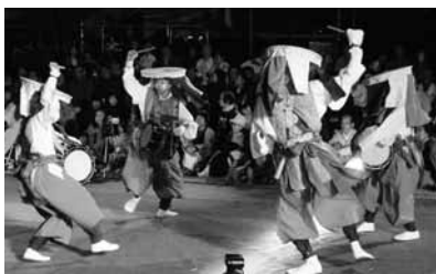
▲昨年の田楽まつりの様子

宇治田楽まつりは、市民の皆さんが中心となり、宇治に伝わる伝統的な芸能「田楽」を、現代に復