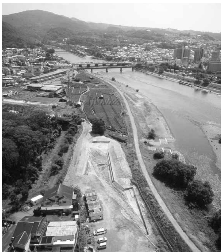
▲宇治川太閤堤跡と宇治の市街地 (平成19年8月撮影)

発行 宇治市 編集 広報課 〒611-8501 宇治市宇治琵琶33 ☎ 22-3141 (代表) FAX 20-8779 ホームページ http://www.city.uji.kyoto.jp/ 携帯 http://m.city.uji.kyoto.jp テレホンサービス ☎ 20-8777