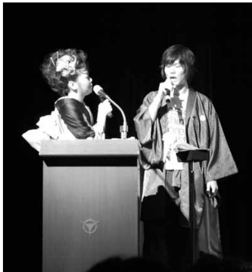
▲あなたも成人式づくりに参加しませんか(写真は昨年の様子)

宇治川中の島一帯で鴨飼が始まります。夏の夕暮れ、皆さんそろってお楽しみください。 ◎期間…6月13日(土)～9月27日(日)。荒天時や増水時は中止することがあります。 ◎乗船場所…府立宇治公園中の島(上流側) ◎出船時間…乗合船は午後7時(受け付けは午後6時から) ◎料金(税込み)…次のとおり (乗合船)大人(中学生以上) 1,800円 小学生 900円 (貸切船(要予約)) 10人乗り 25,000円 15人乗り 37,500円 20人乗り 50,000円 ◎貸切船の予約先…(有)宇治川観光通船 (☎21-2328) ◎問い合わせ…(社)市観光協会(☎23-3334)、同通船