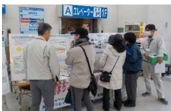
③コーナンJ R宇治駅北店 (1)