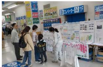
③コーナンJ R宇治駅北店 (2)