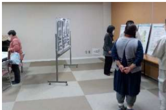
①南宇治コミュニティセンター