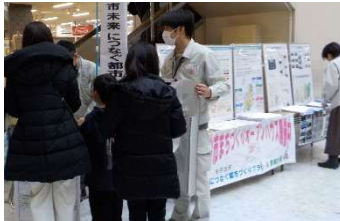
④アル・プラザ宇治東 (1)