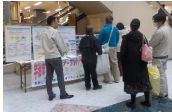
④アル・プラザ宇治東 (2)