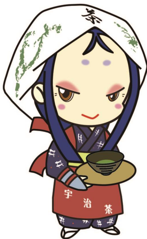
宇治市宣伝大使 ちはや姫