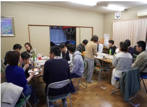
《地域の交流会“スナック地蔵”の様子》

本イベントは、ろくみら実行委員会が主催する地域の交流会“スナック地蔵”において、参加者同士が「この地域でこんなことができればいい」「この場所をもっと魅力的な場にしたい」と、 地域の未来について語り合ったことをキッカケに実現した ものです。