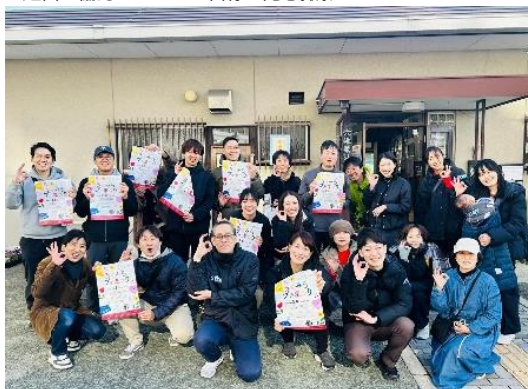
《運営に協力いただいた皆様と記念撮影》

今後は、 まちの縁がわ促進事業 を通じて生まれたさまざまな「 縁 」が「 輪 」となっていくことで、この場所がより一層、地域の憩いの場・集いの場として定着していくよう、引き続き皆様とともに積極的に取り組んでまいります。