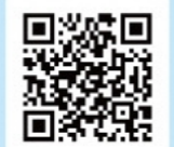
Sakura Festival English

会場：京都府立宇治公園中の島 お問い合わせ先 (公社) 宇治市観光協会 / TEL 0774-23-3353