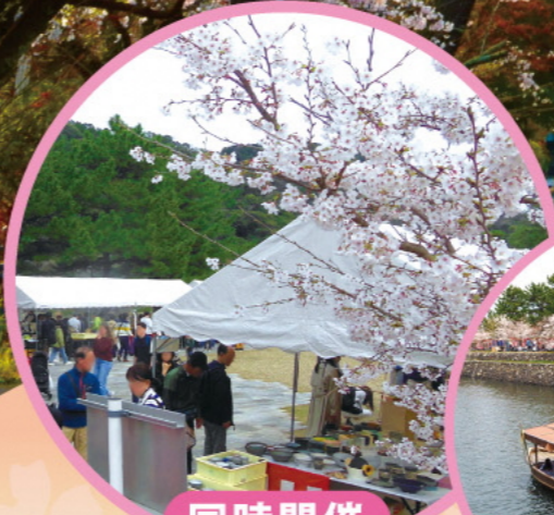
同時開催 第47回 炭山陶器まつり