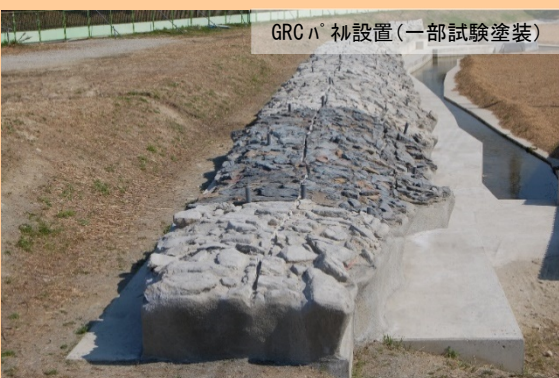
GRCパネ設置(一部試験塗装)