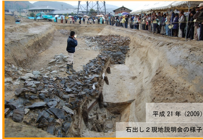
平成 21 年 (2009)