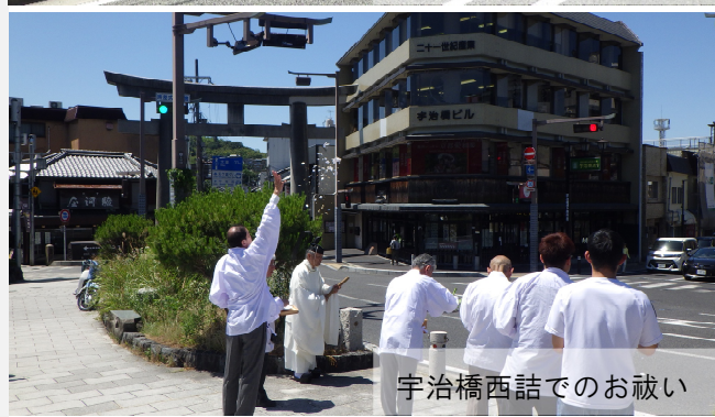
宇治橋西詰でのお祓い