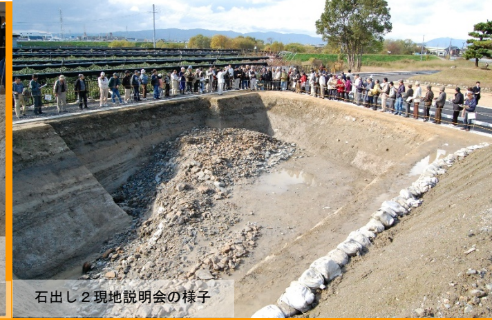
石出し 2 現地説明会の様子