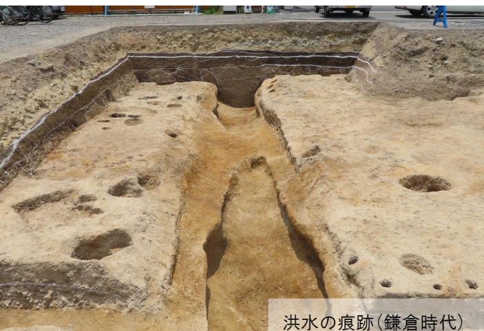
洪水の痕跡(鎌倉時代)