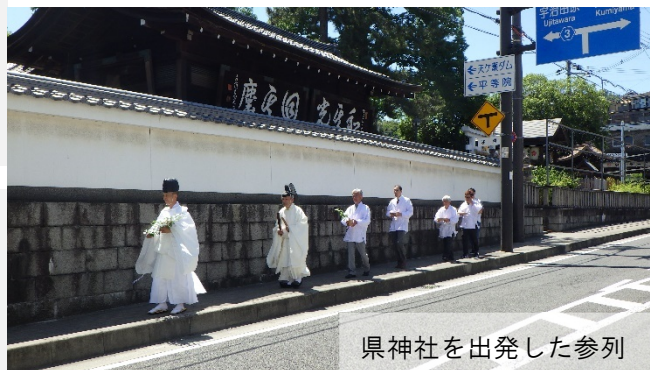
県神社を出発した参列