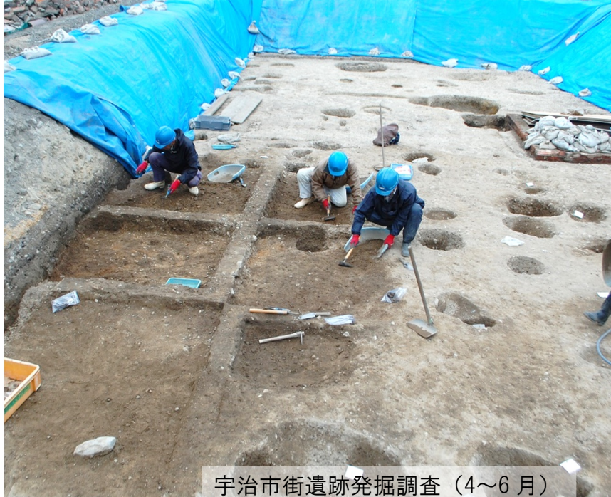
宇治市街遺跡発掘調査 (4~6月)