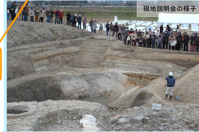
現地説明会の様子