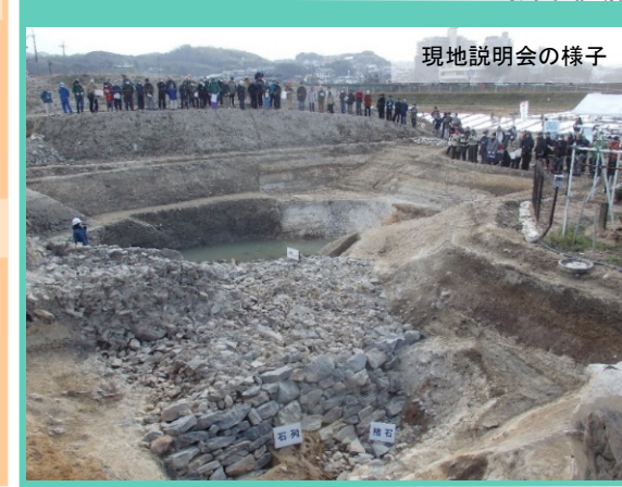
現地説明会の様子