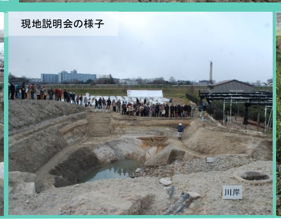
現地説明会の様子