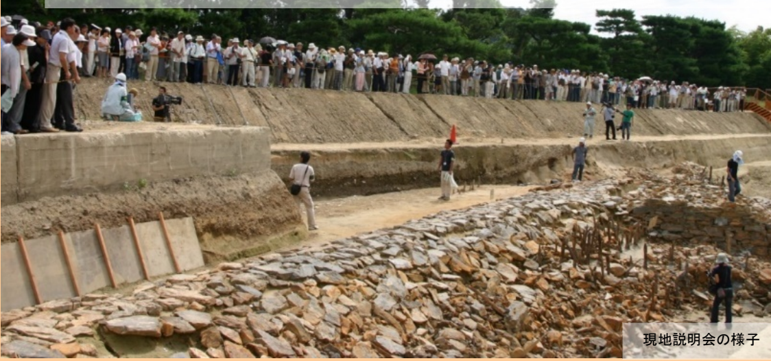
現地説明会の様子

平成 19 年 (2007) 宇治川太閤堤跡は、宇治橋下流の宇治川右岸での土地区画整理事業に伴う発掘調査により発見されました。豊臣秀吉によって築造された治水遺跡を見学し約 1600 人の方が現地説明会に来られました。