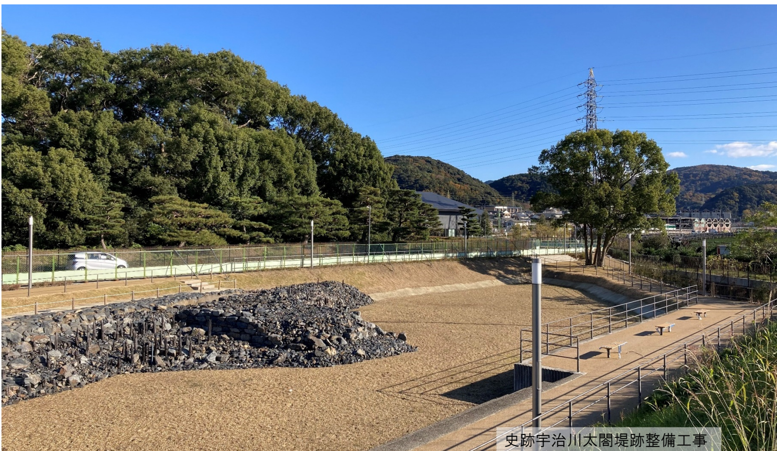
史跡宇治川太閤堤跡整備工事