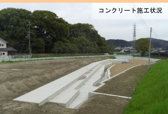
コンクリート施工状況