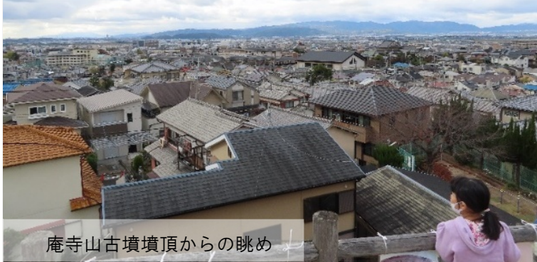
庵寺山古墳墳頂からの眺め

毎年春と秋に墳頂を開放し、一般公開しています。今年度は秋のみ一般公開を実施しました。