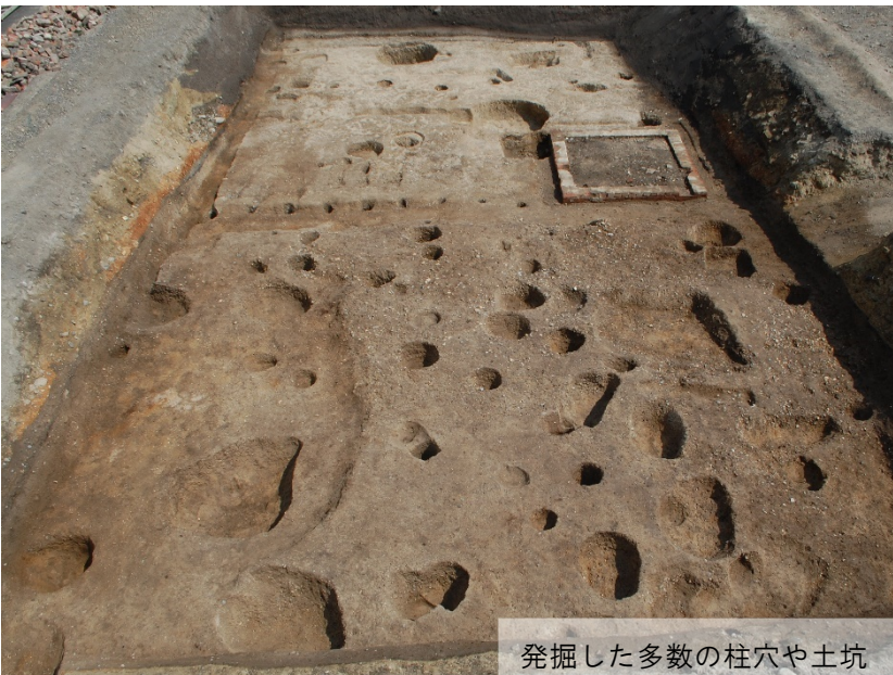
発掘した多数の柱穴や土坑

今回の調査では、土師器皿、瓦片及び白磁片が出土したほか、大きな溝と溝に並んで杭が打たれていた護岸のようなものが存在していたことが分かりました。