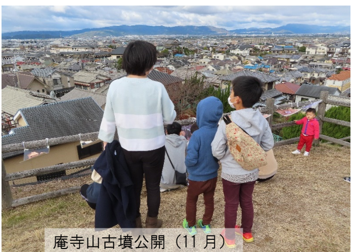
庵寺山古墳公開 (11月)